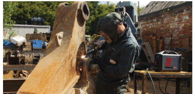
Onderhoud en reparatie