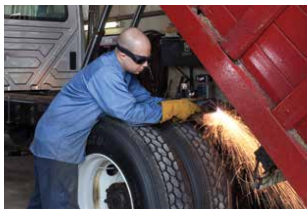
Voertuigreparatie en -aanpassing